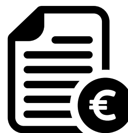
Begroting en dekkingsplan